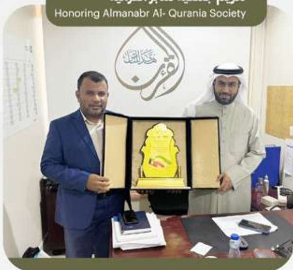
تكریم جمعية منابر القرآنية Honoring Almanabr Al- Qurania Society